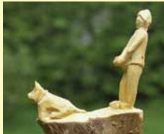
Links: Skulpturen aus Weidenpfählen 2017